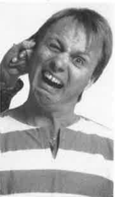
IN NELLIE NEUF

Kunstutstillingene i "Lille meierigården" vil stå til 19.juni. Historielagets utstilling "Den første Liung" vil bli vist i hovedbiblioteket som er åpent begge Lierdagene og bli stående utover i juni. Publikum vil finne en mengde andre utstillinger ute og inne under Lierdagene!