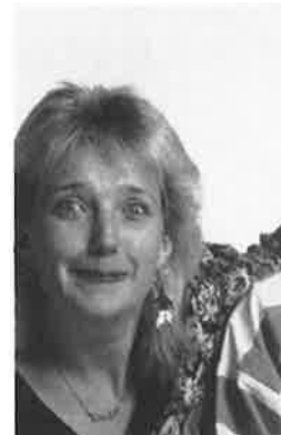
KNUTSEN PÅ FRIFOT M søndag kl.14.50 Iført sin fangedrakt lengere tid vært politiet. Hele landet på NRK-TV. Der har Nellie Neuf ut på spøkelses og forsvarer bør også være kjent & Ludviksen!"