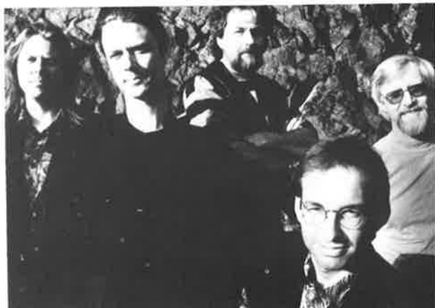
HILLBILLIES MED FETENDE COUNTRY-ROCK lørdag kl.16.00. Gruppen som har spilt seg inn på førsteplasser både på Buskerudtoppen og Norsktoppen med sin meget norske country-rock gir oss en times konsert denne ettermiddagen!