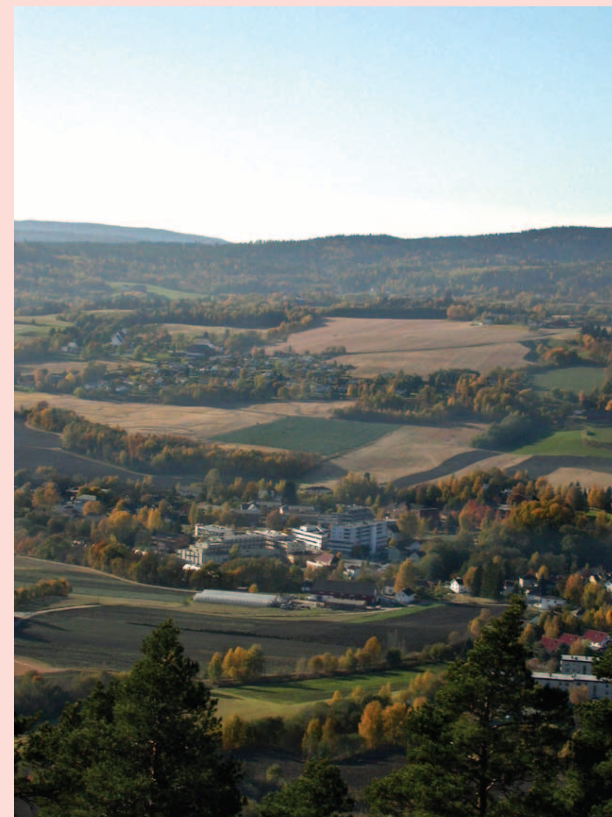
Utsikt til Lierbyen