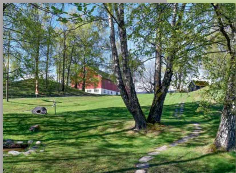
Bjørka står i sitt lyseste grønt.

«St. Hallvard-runden» er en rundløype på 5 km. Runden følger Pilegrimsleden deler av veien og er ellers merket med eget symbol.